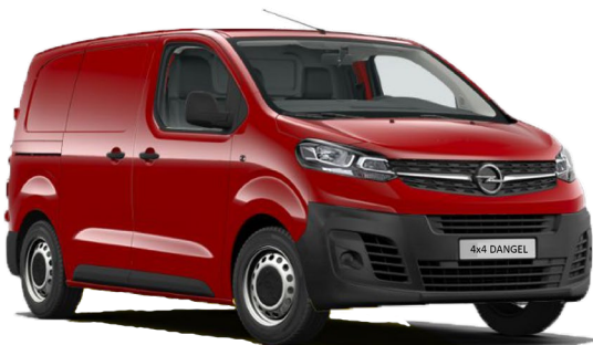
Opel Vivaro Trek & 4X4 p. 4 & 5