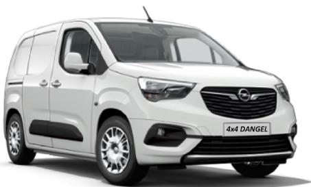
Opel Combo Trek & 4x4 p. 2 & 3